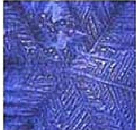
Después de ser tratada con el Activador de Agua Vital, comprobamos que ha tomado la estructura de agua de manantial. (aumento de x400)

En la imagen ampliada puede apreciarse claramente la forma de estrella, que es frecuente en agua de manantial. La revitalización y la aproximación a una calidad natural se ha realizado y la prueba tiene un nivel de energía positivo y mayor que en la prueba neutral. Tiene un efecto vitalizador para el consumidor. La densidad del agua ha aumentado con respecto al agua neutral. El metabolismo humano se estimula y potencia positivamente a través de la alta biodisponibilidad de los oligoelementos y del superávit energético lo cual indica una mayor biodisponibilidad de los minerales y oligoelementos. La prueba por lo tanto reconoce el valor de esta agua como alimento, a la que debe atribuírsele un alto valor biológico. Las imágenes hablan por sí mismas.