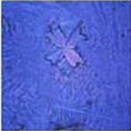
Agua neutral de grifo de Überlingen, con un aumento de x400.

El resultado de las imágenes de cristal, pertenecientes a ésta prueba, es excelente: