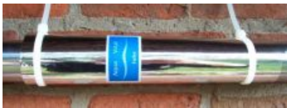
Lámina descalcificadora/vitalizadora CHI-Energie